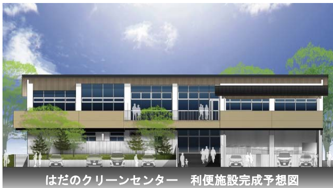
はだのクリーンセンター 利便施設完成予想図

はだのクリーンセンターの建設に伴う(温浴施設)に対し、建設工事の請負契約(契約金：3億4,722万円)を締結する議案が市長より提出され、賛成多数で可決しました。