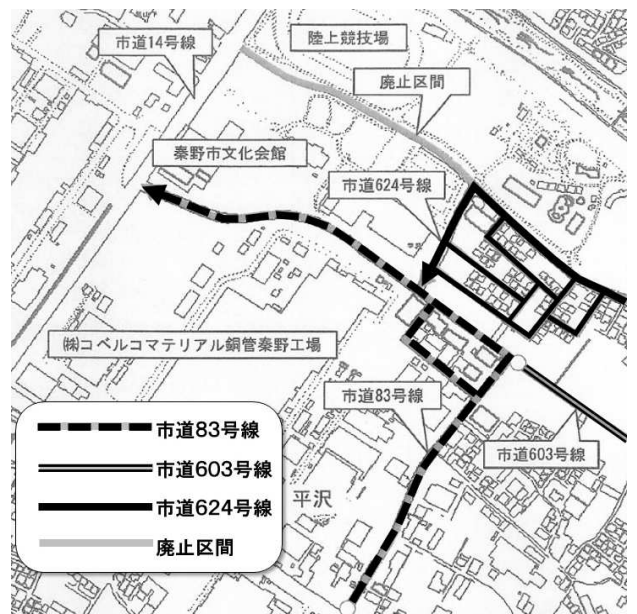
▲中央運動公園付近 変更後の地図

カルチャーパーク再編事業において、これまで中央運動公園の文化会館・総合体育館と、陸上競技場・テニスコートの間を通っていた市道83号線の一部(パサデナ通り)を廃止するなどの提案が出され賛成全員で可決しました。このパサデナ通りは中央運動公園を横断し車の通行も多かったため、公園の利用者から危険だという声が上がっていました。私は道路の利用者や近隣自治会、隣接企業などの意見の把握が不十分であると感じましたが、交通量の調査結果などを十分に踏まえた提案と判断し賛成しました。同時に、文化会館北側の信号が、市道83号線の終点に移動します。なお、この工事は年末年始に順次実施されます。