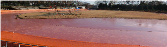
▲全天候の工事が行われている陸上競技場

市内施設の使用料金改訂について、中央運動公園陸上競技場の個人使用の有料化、中央運動公園水泳プールの更衣室ロッカー使用の無料化、また、おおね公園多目的広場について全面貸出から半面ずつの貸出とし有料化する提案がされ、賛成多数で可決しました。